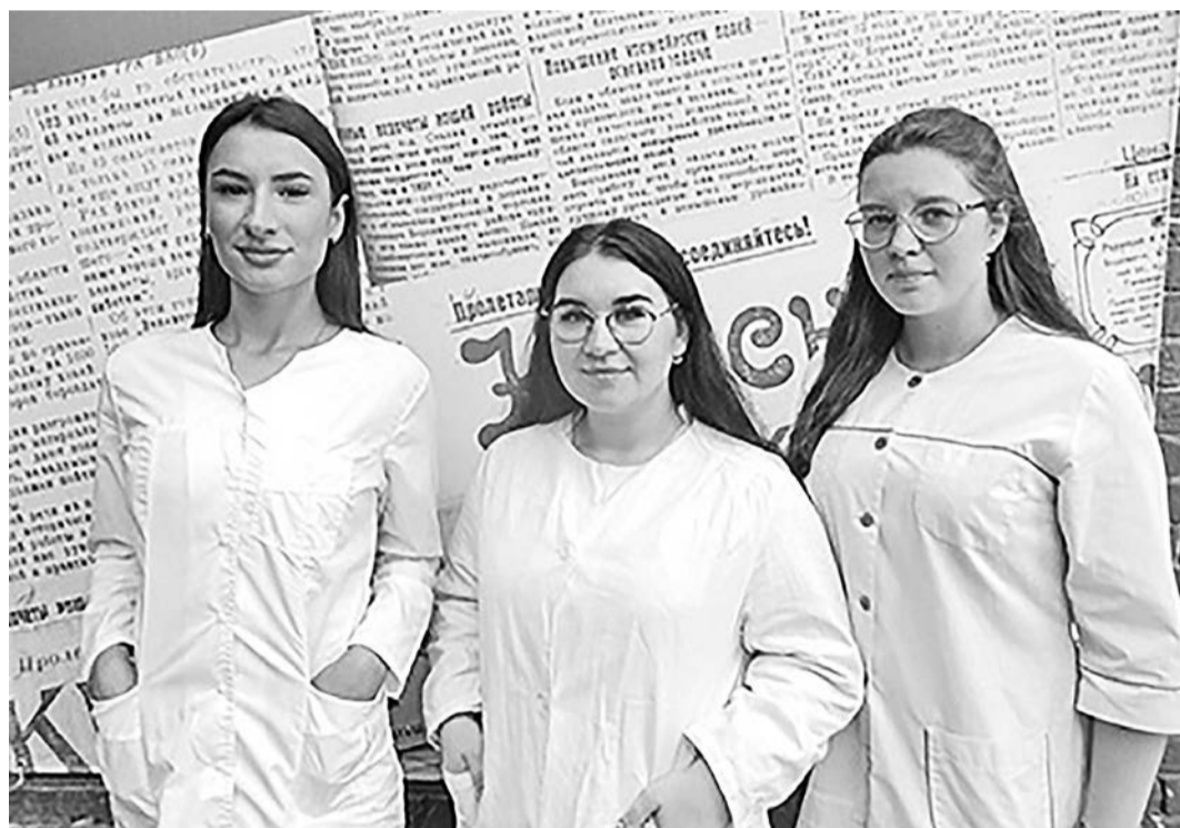
Выпускницы Боровиского медицинского колледжа работают в медучреждениях области

молодым медицинским работникам, окончившим образовательную организацию и трудоустроившимся в медицинскую организацию в 2021 году. Выплаты планируется осуществлять с сентября 2021 года.