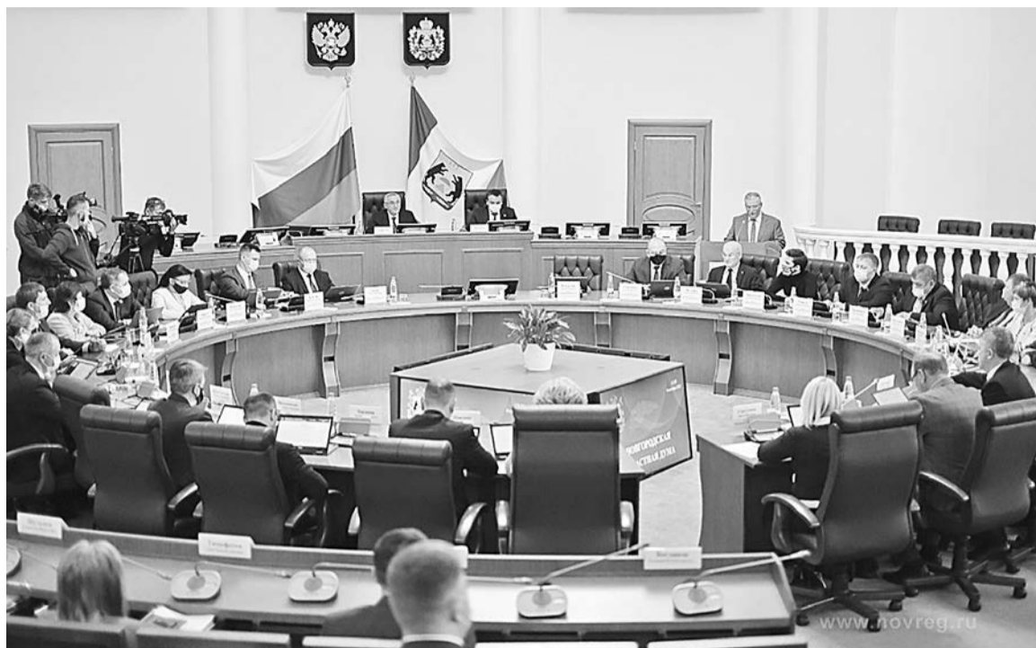
Первое заседание областной Думы в новом составе

Одним из вопросов, которые депутаты рассмотрели на первом заседании, стал законопроект, поддержанный губернатором, о дополнительных мерах социальной поддержки молодых специалистов системы здравоохранения Новгородской области, осуществляющих трудовую деятельность на территории муниципального района или муниципального округа Новгородской области в