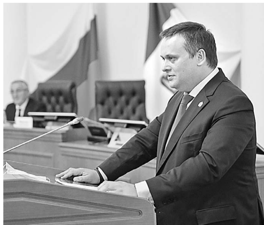
Губернатор Новгородской области Андрей Никитин